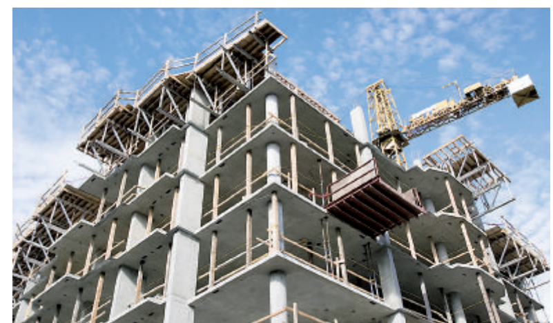
Moderne Gebäude verfügen über eine Vielzahl von miteinander verknüpften Infrastruktursystemen.